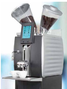
Mod. CT 1S Con nevera exterior 15 lit.