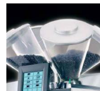
hasta 4 molinos independientes