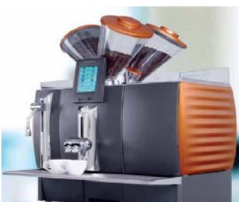
Mod. BCL Con nevera de 5 litros incorporada.