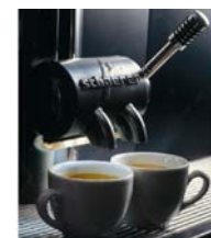
2 tazas a la vez